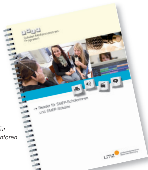
Schulungsmappe für Schüler-Medienmentoren